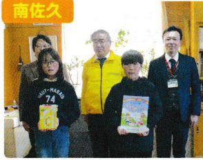
新入学児童への安全冊子贈呈式