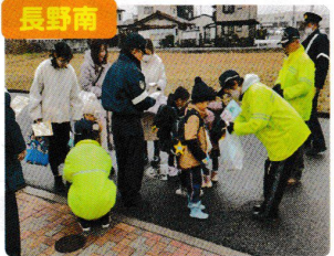
幼稚園児への交通安全指導