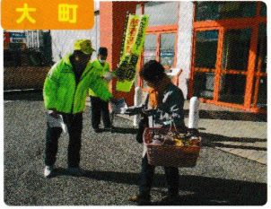
交通死亡事故緊急抑止対策