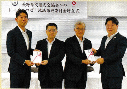
「日本生命保険相互会社 長野支社・松本支社」様