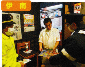
飲酒運転防止パトロール