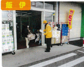
交通死亡事故抑止対策