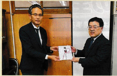
「信越放送株式会社」様

令和7年9月に、日本生命保険相互会社 長野支社・松本支社様より、また、令和8年1月には、信越放送株式会社様より、当交通安全協会が実施しております交通安全広報啓発活動等の一助として、寄付金を贈呈いただきました。交通安全協会では、いただいた寄付金を今後の各種交通安全啓発活動に有効活用して参ります。