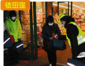
ピカピカペッタンコ作戦